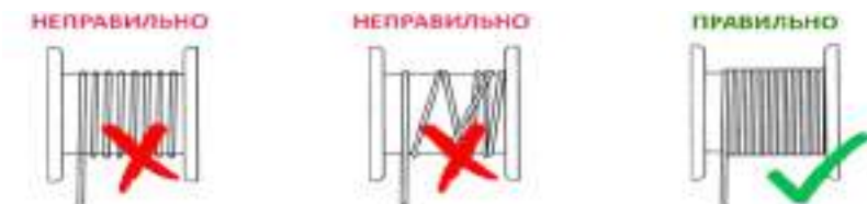
Рисунок 3. Намотка троса на катушку.

Лебедка модели FD оснащены храповым механизмом, препятствующим произвольному вращению барабана. При работе с лебедками категорически запрещается снимать фиксатор храповика.