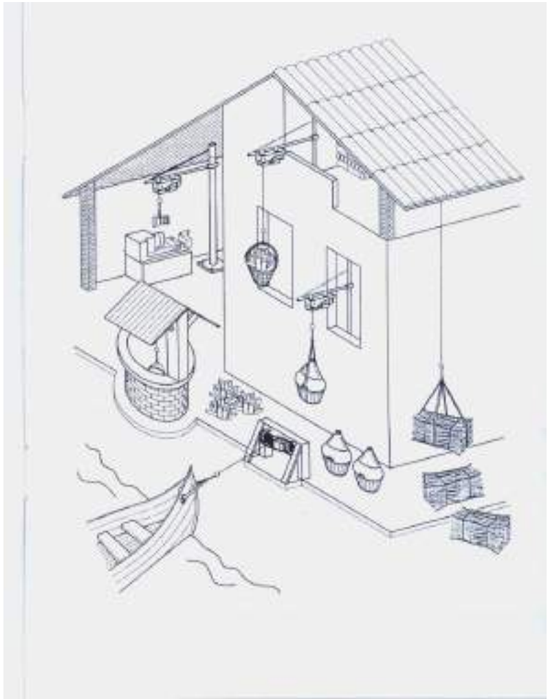
Рисунок 6. Пример использования мини тали электрической.