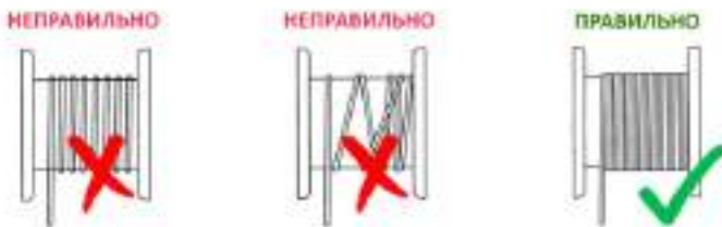
Рисунок 3. Намотка троса на катушку.