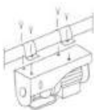
Рисунок 1. Схема крепления мини тали.

Подготовьте тележку для установки на двутавровую балку. Для этого замерьте ширину полки балки и выставьте этот размер на тележке с помощью регулировочных шайб. Рекомендованный зазор 1-3 мм. Установите мини таль на двутавровую балку. Стороны электрокаретки должны быть зафиксированы параллельно друг другу, не болтаться. Колёса каретки должны вращаться свободно без заеданий и без больших зазоров. Что бы таль не перекашивало весом двигателя в положении «без нагрузки» - выставьте и зафиксируйте отдельно стоящий ролик, который прижимает конструкцию к двутавру. Обязательно проверьте уровень горизонта двутавра. Наклон более 1% недопустим.