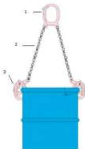
Рисунок 2. Устройство захвата.

Захват состоит из стального овального звена (1), двух цепных ветвей (2), двух рычажных захватов на концах цепных ветвей (3) Рисунок 2.